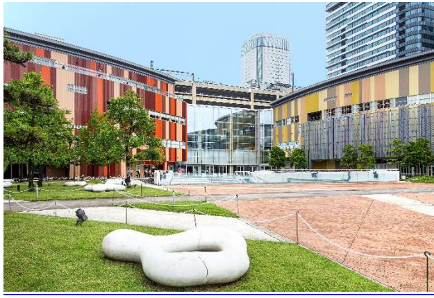
三井ショッピングパーク アーバンドック ららぽーと豊洲 外観

当社は、引き続き電力事業とモビリティ事業を通じて、経済性と利便性の提供と、脱炭素社会の実現に貢献してまいります。